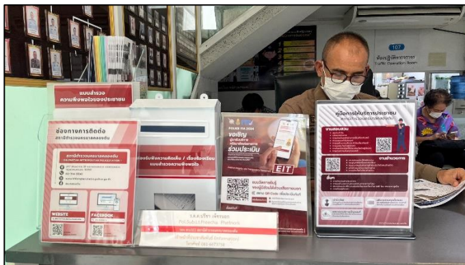
ช่องทางการติดต่อเรื่องร้องเรียน สถานีตำรวจนครบาลคลองตัน