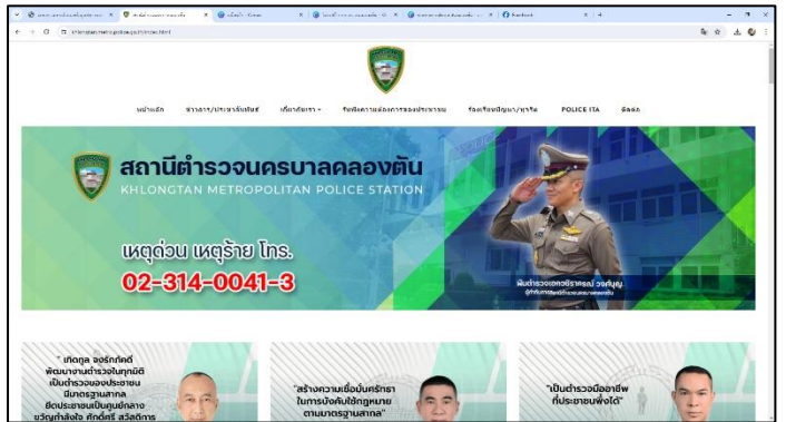
ช่องทางร้องเรียน เว็บไซต์ สถานีตำรวจนครบาลคลองตัน