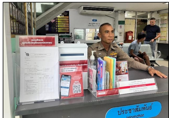
กล่องรับข้อคิดเห็น/ข้อร้องเรียน สถานีตำรวจนครบาลคลองตัน